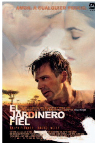
El jardinero fiel