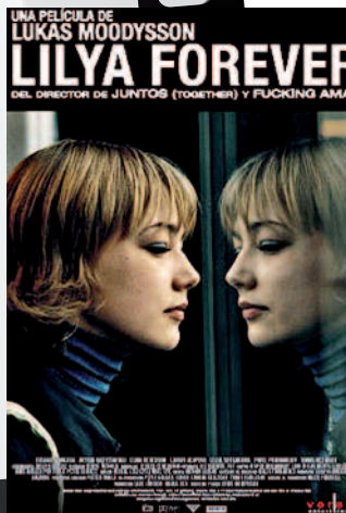
Las alas de la vida

En el próximo curso contaremos con: Wit. Amar la vida y Las confesiones del Dr. Sachs