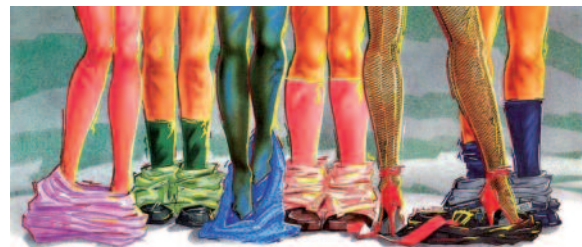
VERÓNICA FORQUE ANTONIO RESINES ANA OBREGÓN GUILLERMO MONTESINOS MASSIEL MIGUEL RELLAN