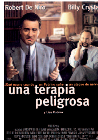
Una terapia peligrosa