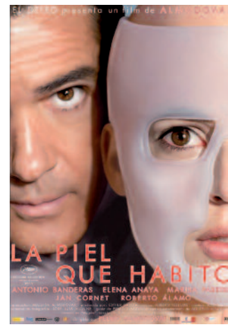
La piel que habito