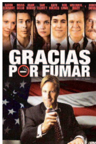
Gracias por fumar